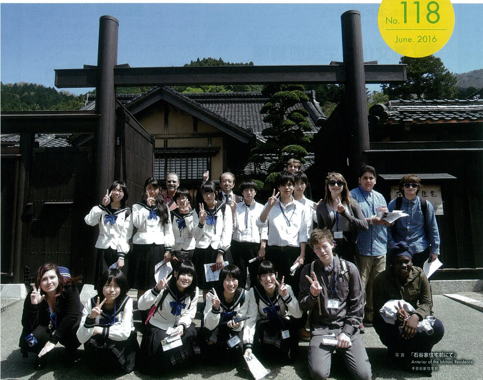
写真 「石谷家住宅前にて」 Anterior of the Ishitani Residence 于石谷家住宅前