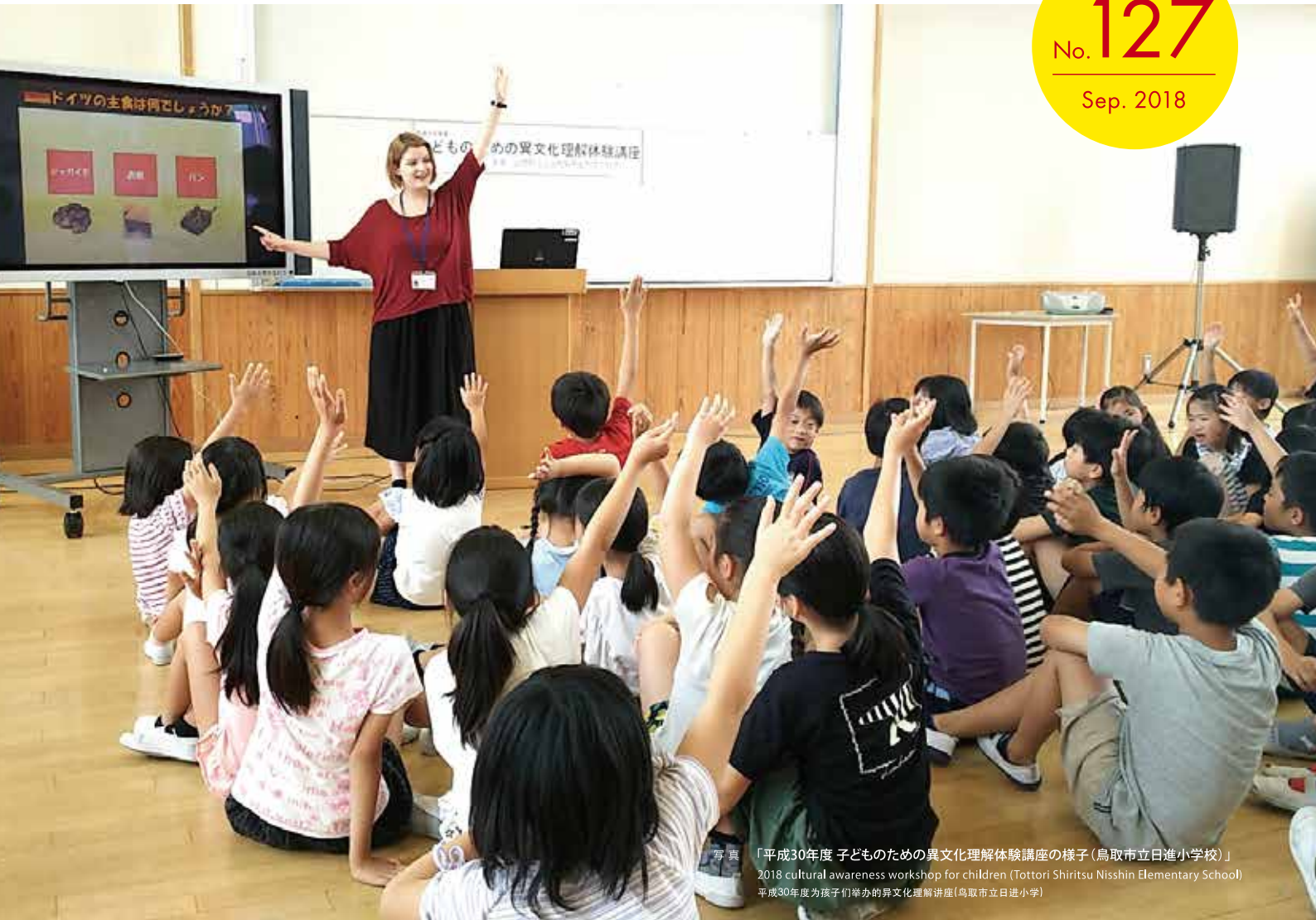
写真 「平成30年度 子どものための異文化理解体験講座の様子(鳥取市立日進小学校)」 2018 cultural awareness workshop for children (Tottori Shiritsu Nisshin Elementary School) 平成30年度为孩子们举办的异文化理解讲座(鸟取市立日进小学)