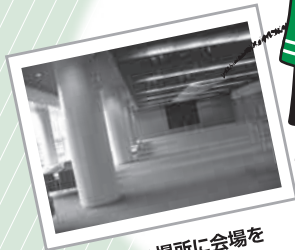
何も無い場所に会場を作りあげていきます