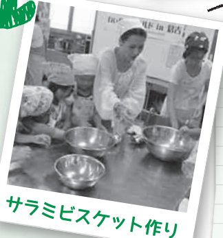
サラミビスケット作り

「バナナトロン」は、砂糖を油に入れてからバナナを揚げるのです。これには見ていた保護者もビックリ! 子どもから大人まで驚きと笑いがいっぱい、あっという間の3時間でした♪