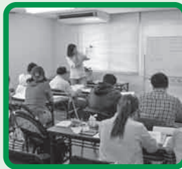
日本語クラス(中部)

ボランティアさんは、分からないところはいいに何回も教えてください。日本人と同じように話せるようになり、仕事でも日本語を使いたいという目標があるので、発音をきちんと教えてもらえるのが、とても助かります。クラスで先生やボランティアさんと話すのも、とても楽しいです。