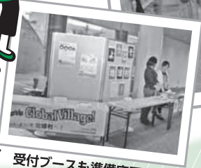
受付ブースも準備完了。笑顔で対応します