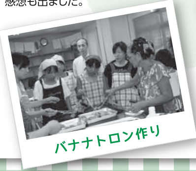
バナナトロン作り

体を動かしたあとは、1~3年生が作ったルーマニアの「サラミビスケット」、4~6年生が作ったフィリピンの「バナナトロン」(揚げバナナ)と「ハロハロ」(かき氷)を食べながら、台湾のお話を聞きました。台湾は外食が日常なことや、南国フルーツがたくさん採れることを聞いて「いつか行ってみたい!」という感想も出ました。