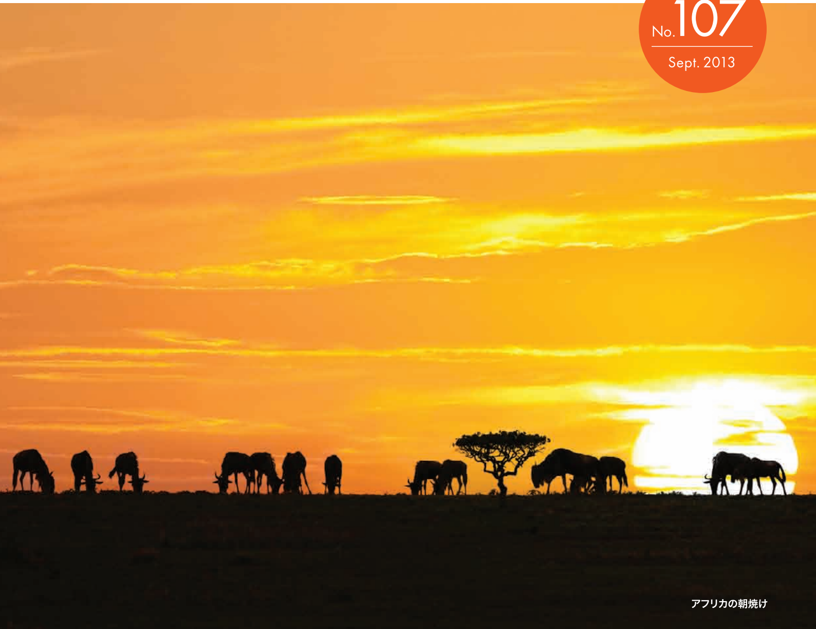
アフリカの朝焼け