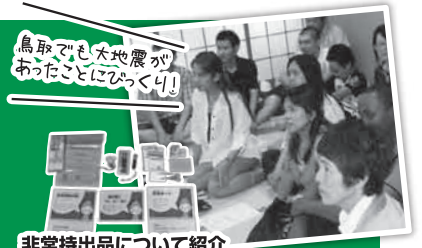
非常持出品について紹介

最後に講師からの、非常持出袋の用意も必要だが、危険を感じたらすぐに逃げることに、まずは自分の命を守ることが一番大切だという話には、参加者全員真剣に、聞き入りました。「地震の時にこんなに注意することがあるとは知らなかった」、「持出品が手に取って見られたことが良かった」、「自分を守るために日頃の準備が必要ながよくわかった」等の感想がありました。