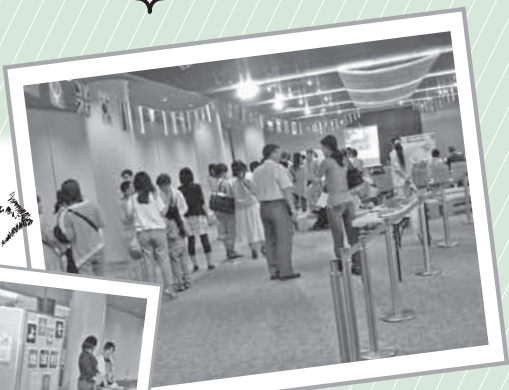
万国旗を天井に張り巡らせ、椅子や机を設置しました!