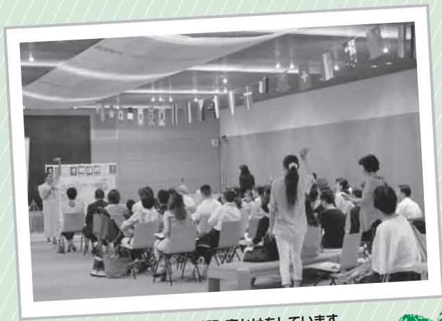
後ろから、絶妙なタイミングで通訳・声かけをしています

会場では、司会役のフィリピン、フランス、アメリカ出身ゲストが、特技を披露したり、クイズやゲームなどを織り交ぜて英語で自国や自分自身について紹介しました。司会者以外にも当日は中国、台湾、マレーシア、南アフリカ出身者が参加してくれ、その場で即席インタビューも行われました。さらに、会場に集まった人同士が自由に交流するフリータイムでは、ゲストを含めた皆さんで積極的に英語でおしゃべりをするなど、いろいろな人の話す英語がシャワーのように降り注ぎました。