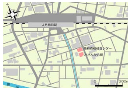
会場図(さざんか会館・高齢者福祉センター)